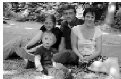
Familie im Park

Der Familienratgeber sucht deshalb noch weitere Regionalpartner, die diese Informationsplattform mitgestalten. Über 120 regionale Netzwerke sind bereits aktiv. Damit jeder Suchende auch das Richtige findet, ist es wichtig, dass möglichst viele regionale Ansprechpartner für die Behindertenhilfe und -selbsthilfe ihre Daten selbst einpflegen und regelmäßig aktualisieren. Alle Informationen sowie das Formular zur Dateneingabe finden Sie unter www.familienratgeber.de . Bei Fragen wenden Sie sich bitte direkt an die Aktion Mensch.