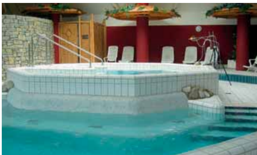
Messwerteerfassung an einem Whirlpool

In 3 Bädern wurde an insgesamt 4 Messpunkten der vom INRS für Stickstofftrichlorid vorgeschlagene Grenzwert \leq 0,5 \text{ mg/m}^3 erreicht bzw. überschritten.