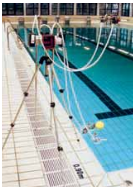
Messapparatur für Trichloramin