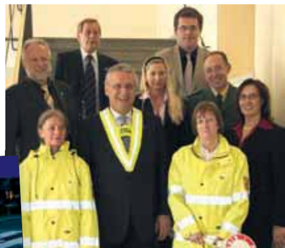
GA-Träger mit Herrn Staatsminister Herrmann; links: Plakat „Funkeln im Dunkeln“. Sie finden unser Plakat auch auf unserer Homepage www.bayerguvv.de

Eltern sollten auch immer darauf achten, dass die Kleidung ihrer Kinder entsprechend auffällig ist: helle Farben, Reflexstreifen, Leuchtkappen und Katzenaugen-