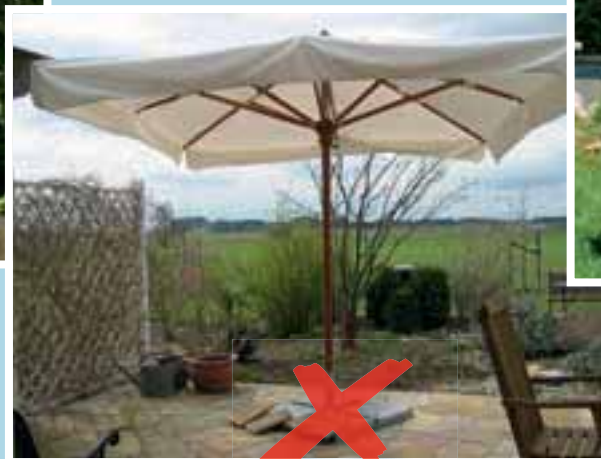
2 Marktschirm: Schöne, große Beschattungsfläche. Der Schirmständer ist nicht bodenbündig bzw. barrierefrei und daher nicht geeignet