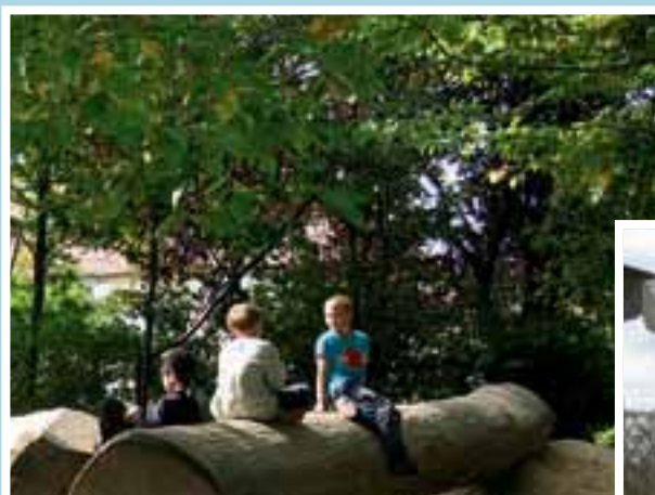
1 Ideale natürliche Beschattung: Alter, dichter Baumbestand

Sie sind gut geeignet zur Beschattung von großen Flächen. Der Auf- und Abbau ist einfach, da das Segel beispielsweise durch abspannungsfreie Federstützen oder durch Seilrollensysteme sicher gespannt und befestigt wird. Einen optimalen Sonnenschutz bieten viereckige Segel. Anspruchsvolle Grundrisse können durch Kombination von mehreren Segeln problemlos beschattet werden. Sonnensegel werden häufig auf Terrassen und über Sandkästen (Bild 3) und Spielplatzgeräten eingesetzt. Bei der Beschattung von größeren Sandkästen haben sich kombinierbare Sonnensegel bewährt, die gleichzeitig als Sonnen- und Sandkastenschutz (gegen Verschmutzung, Katzenkot etc., Bild 4) dienen.