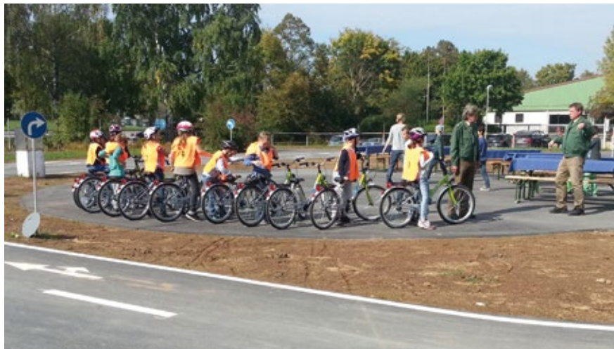
Die Grundschüler in Aktion: Zusammen mit der Polizei wird auf dem Übungsplatz der Jugendverkehrsschule Knetzgau für die Fahrradausbildung geübt.

Die Fahrradausbildung in der Jugendverkehrsschule beginnt immer in der zweiten Woche nach den Sommerferien und endet