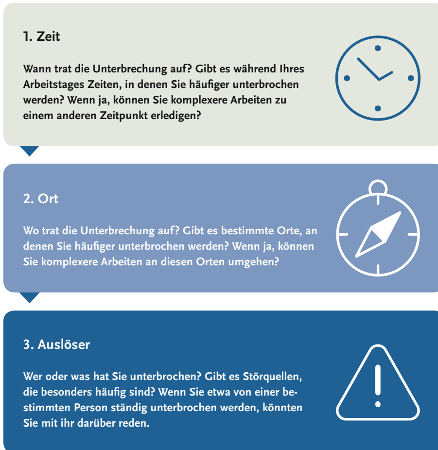
Abb. 2 Fragen, um Unterbrechungsquellen zu bestimmen.

Die wichtigsten Fragen, um eine Unterbrechung zu verstehen: Wann und wo trat sie auf? Wer oder was hat unterbrochen?