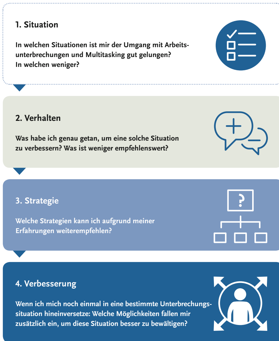
Abb. 1 Vier Fragen, um Unterbrechungen und Multitasking zu meistern.

Folgende Fragen können dabei unterstützen, eine persönliche Strategie zur Bewältigung von Arbeitsunterbrechungen und Multitasking zu entwickeln: