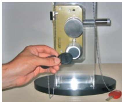
Türklinke mit Chip